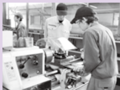
▲削り出し加工の技術を学ぶ受講生

★津山ステンレスクラスタースタートが取り組む人材育成 津山ステンレスクラスタースタートは毎年、津山工業高等専門学校との協力も受けて、津山地域ステンレス関連企業の若手技術者に各種技術教育を行っています。ステンレスを中心とした金属の削り出し加工、溶接、板曲げ加工などの加工技術を習得させ、将来の現場リーダーを育成しています。今年度は新たに各現場でコスト改善ができる人材育成の取り組みを始めました。 ★現場からのコスト力向上を目指して この新しい取り組みの目的は、常にコスト削減を意識して、改善案を実践できる力の向上です。昨年5月から半年間、職場でのコスト改善、品質管理の考え方を指導しました。この指導の特徴は、机上での講習だけでなく、机上を受講生が職場で抱えている問題をテーマにして、コスト削減、品質改善に向けて講師も一緒に現場で実践する