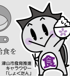
津山市食育推進 キャラクター 「しよくだん」

学校給食は、「主食・主菜・副菜」がきちんとそろった食事です。給食を活用して、栄養教諭などが授業の中で、食育指導を行っています。