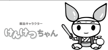
原画キャラクター けいけちゃん