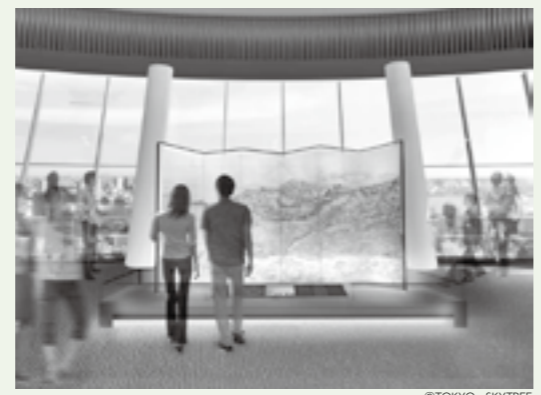
▲第1展望台に設置する屏風のイメージ

平成24年5月22日に開業する東京スカイツリー（東京都墨田区）の第1展望台に、津山郷土博物館所蔵の「江戸一目図屏風」の実物大複製が設置されます。この屏風は、津山藩のお抱え絵師・鍛形憲斎が文化6年（1809）に江戸の全景を詳細に描いた景観図で、大きさは縦176センチ、横353センチです。屏風の描写構図とスカイツリーから見渡した眺望が似ていて、地上350メートルの第1展望台から見比べることができます。