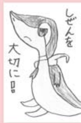
▶ペンネーム・マスク (小学4年・河辺)