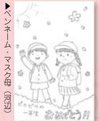
▶ペンネーム・マスク母 (河辺)