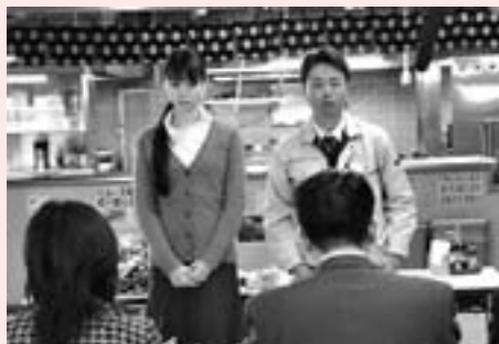
▲市役所地下食堂でのシーン

今、津山はホルモンうどんで全国的に注目を集めています。それ以外のものでもどんどん有名になってほしいですね。そ