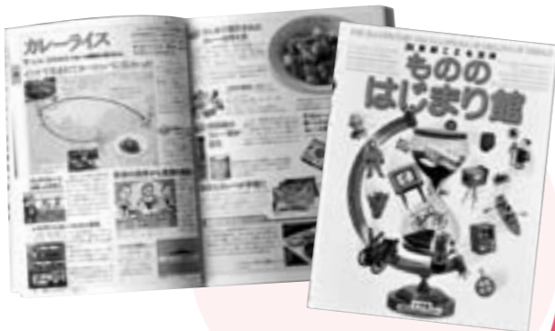
『21世紀子ども百科もののはじまり館』 近藤二郎・監修 (小学館)