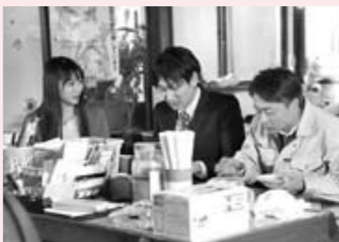
▲市内飲食店でのシーン

り鍋もおいしいと思うし、それとメッチャうまい和・洋菓子がたくさんありますね。これも津山を発信する一つのアイテムだと思います。