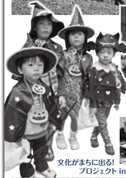
文化がまちに出る! プロジェクト in 津山