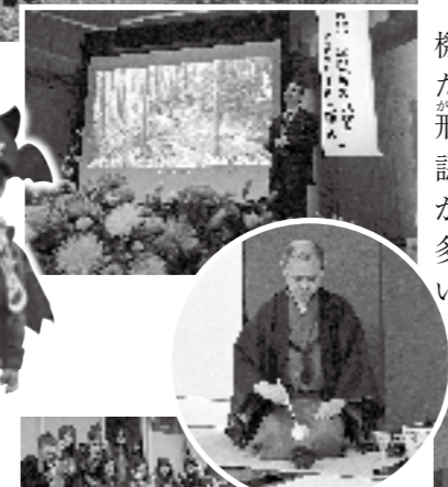
茶道 フェスティバル