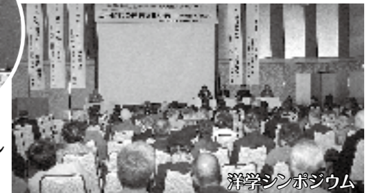
洋学シンポジウム