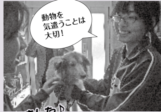
▲犬の世話をしています▲