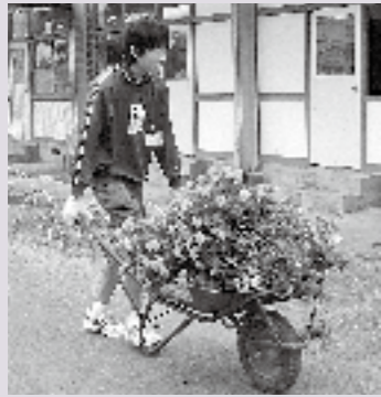
▲抜いた草花を運びます