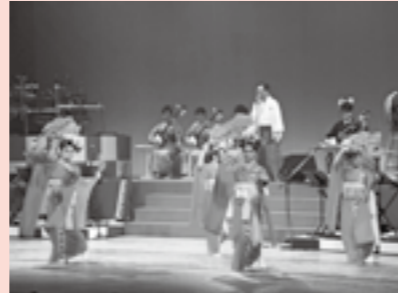
▲昨年のプレ公演の様子