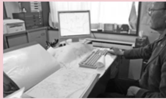
▲災害福祉マップを作成している様子

「民生委員・児童委員の表札」の作成が進み、また民生委員・児童委員が「災害福祉マップ」を作成している地区も出てきています。一昔前であれば、地域のことは地域住民自身が把握していましたが、近所付き合いが希薄化してきたといわれる近年、民生委員・児童委員の役割は人と人をつなぐ担い手として、ますます大きくなっています。