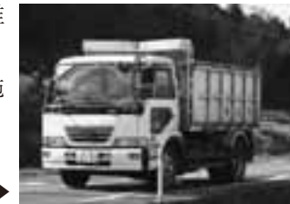
焼却灰を持ち出すダンプカー▶