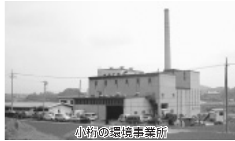
小桁の環境事業所