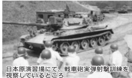
日本原演習場にて、戦車砲実弾射撃訓練を視察しているところ