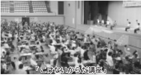
「こけないからだ講座」