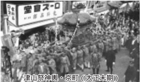
津山祭神輿・京町(大正末期)

販売農家で、標準的な生産費と販売価格との差額を全国一律単価として農家に直接支払うものである。 質問 公共交通空白地域での輸送手段を確保する施策は。 回答 地域力を活用した、過疎地有償運送や民間事業者を活用した、デマンド乗合方式を提案し、支援については補助制度を活用したいと考えている。 質問 今後の経済・雇用状況好転に向けての施策は何か。 回答 「公共工事前払い金の増額」などの事業を継続させ、国の雇用創出基金を活用した事業により、七十三人の雇用創出対策を進めていく。