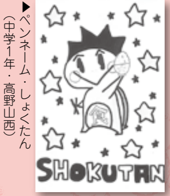
▶ペンネーム・しよくたん (中学1年・高野山西)