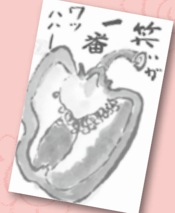
▲宮岡 久枝 (小性町)