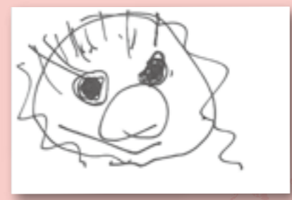
▲渋谷 穂花 (3歳・高野本郷)