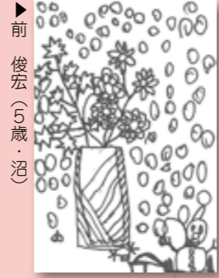
前 俊宏 (5歳・沼)