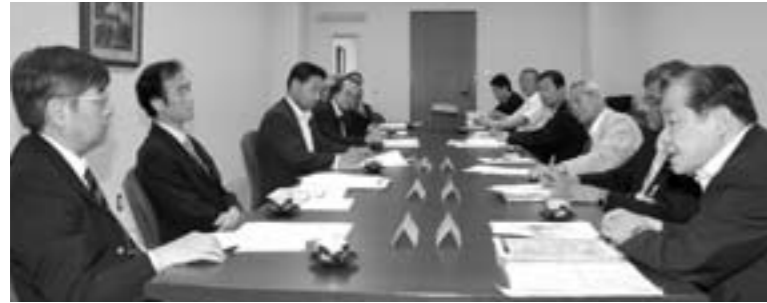
▲6月10日、大学・高専・市の代表者がこれからの連携の可能性を協議

らを取り組むにいてお知らせします。今後津山の文化・技術・教育の振興に向けた新たなチャレンジにご期待ください。