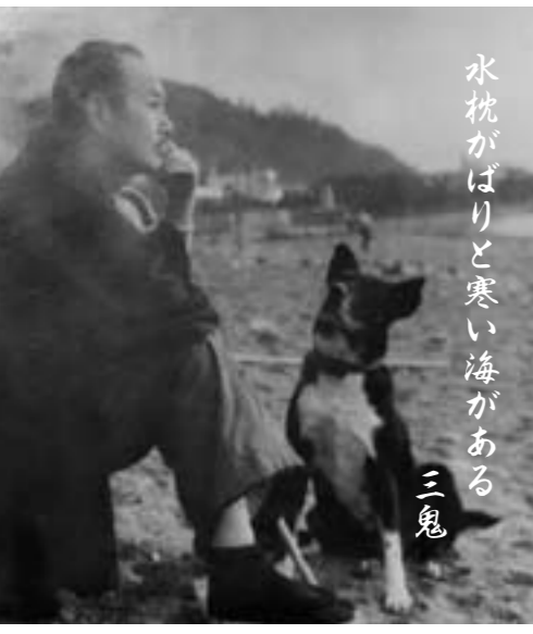
水枕がばりと寒い海がある 三鬼

※応募者全員に入選作品集を送付 問い合わせ先 〒708-8501 津山市山北520 文化振興課内西東三鬼賞委員会（市役所4階）☎32-2121