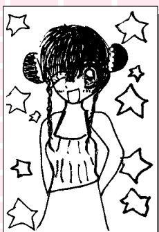
ペンネーム・クッキー (小学6年・下横野)