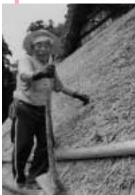
大賞受賞作品「茅苺師」

写真の魅力は、何より感動の瞬間に遭遇できること。また姿・形・彩りによってそれを強く印象付け、人にその感動を伝えられるところにあるでしょうか。これからも健康に気をつけて仲間とがんばりたいと思っています。