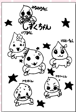
八木 美沙枝 (小学3年・北園町)