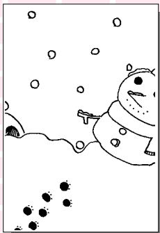
ペンネーム・雪だるま (小学5年・勝部)

ご住所は いる しろくろく 高校生まで 色は白黒。サインペンなどでかく えんぴつ じゆう (鉛筆・ボールペンはダメ) テーマは自由 きんごん さ 採用分には記念品を差し上げます おもて じゆう なまえ かく(ならぬならい) か はがきの表に住所・名前・学年(年齢) を書く ペンネームもOKです 敬称略