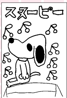
田口 はるみ (小学3年・林田)