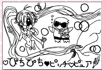
ペンネーム・ヒー (小学6年・林田)