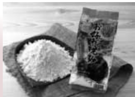
山の芋入りお好み焼粉