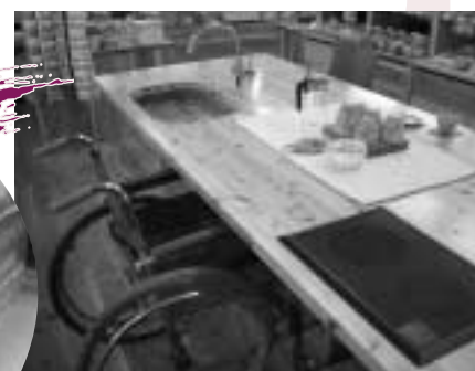
テーブルキッチン