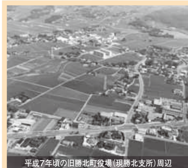
平成7年頃の旧勝北町役場(現勝北支所)周辺