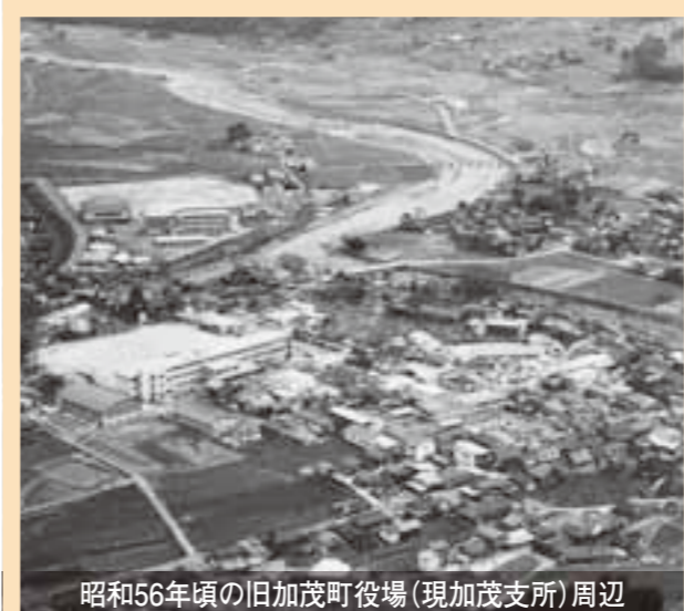
昭和56年頃の旧加茂町役場(現加茂支所)周辺

平成17年2月に津山市に仲間入りした各地域の“ちょっと”むかしの中心部。今ある建物がなかったり、今では新しくなっていたり変化が見て取れます。これからも各地域の拠点として、その重要な役割を担っていくことでしょう