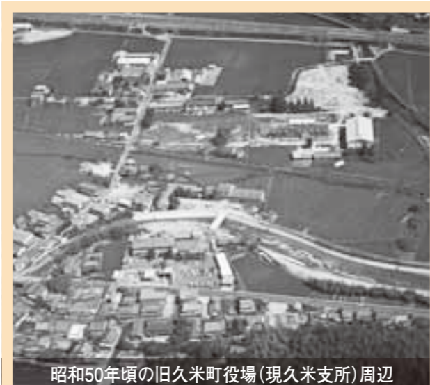
昭和50年頃の旧久米町役場(現久米支所)周辺