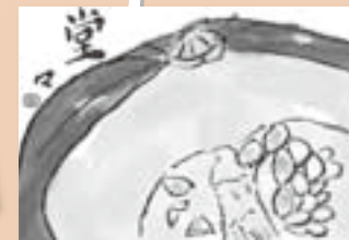
▲ペンネーム・けいこ (小田中)