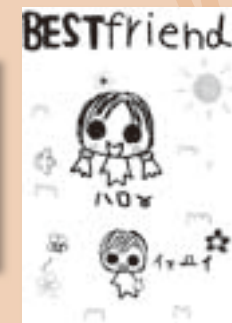
▲ペンネーム・♡SMILE♡ (小学6年・高野山西)