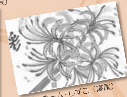
▲ペンネーム・しずこ (高尾)