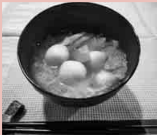
1人分の栄養価 エネルギー176cal、 食物繊維2.8g、塩分1.3g

農業は、わたしたちが毎日口にする食材を生産するとても大切な仕事です。津山市にもたくさん農家があり、農産物の生産に携わっています。そんな津山の農家の皆さんが心を込めて作った食材は、新鮮でおいしく、特別な気持ちを感じられますね。 さて今回は、今注目されている米粉と津山産の新鮮食材を使った料理を紹介します。