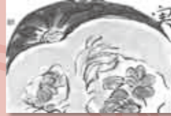
▲ペンネーム・みさこ(鏡野町)