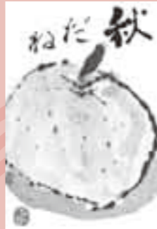
▲ペンネーム・よしみ(平福)