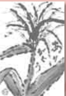
▲ペンネーム・よしえ(平福)