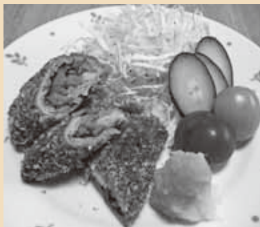
1人分の栄養価 エネルギー187kcal、 脂質5.2g、塩分1.1g