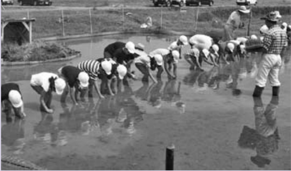
▲「ふるさと学習」での田植えの様子(清泉小学校)

また、地域の皆さんの協力のもと、生活科や総合的な学習の時間に「ふるさと学習」の一つとして、多くの学校で地域の特色を生かした農業を体験しています。子どもたちは、自分の手で土や作物に触れたり、農業者などから作物を育てる工夫や苦労についての話を