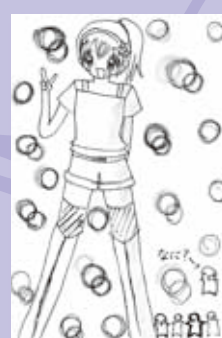
▲平井 光桜 (小学5年・西下)