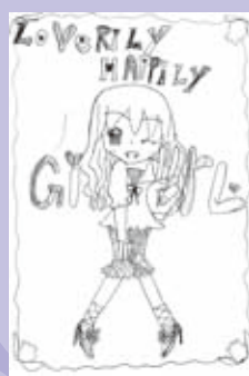
▲ペンネーム・リアン13 (小学4年・一方)