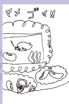
▲平井 綾菜 (小学2年・西下)