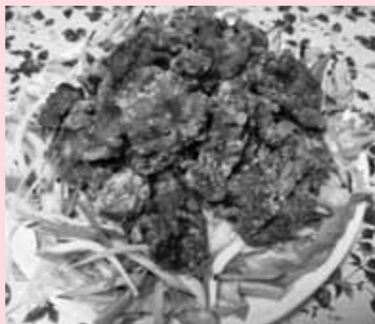
1人当たりの栄養価 エネルギー139kcal、 食物繊維0.8g、塩分1.2g

ダイコンの代わりにたまねぎやコーヤの薄切りをさつとゆでたものを使ってもおいしいです