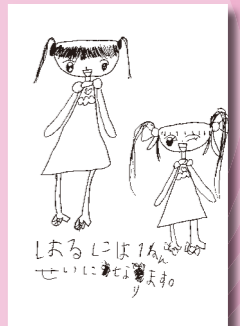
▲真木 愛花 (小学1年・上高倉)