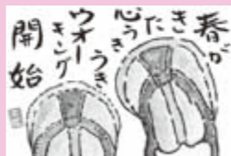
▲河井 文枝 (沼)