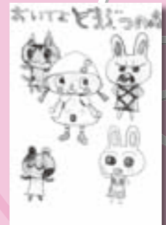
▲宮岡 優 (南方中)