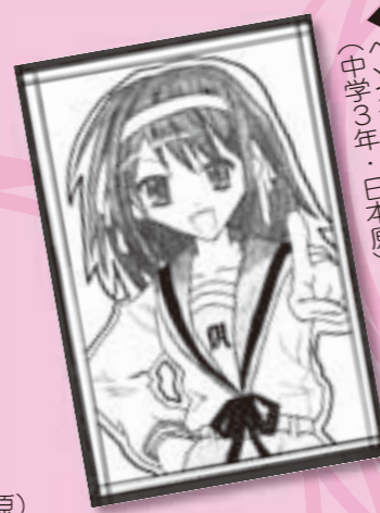
▲ペンネーム・団員あいい (中学3年・日本原)