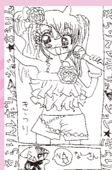
▲垂井 美樹 (小学3年・加茂町中原)