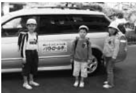
「移動版津山っ子かけこみ110番」。不審者・犯罪防止の働きもしています