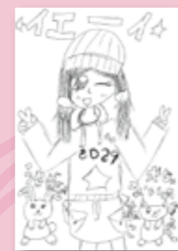
▲尾上 舞 (小学3年・西吉田)