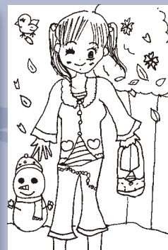
▲倉本 咲良 (小学3年・加茂町知和)