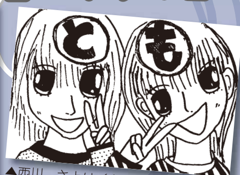
▲西川 さより (小学5年・平福)