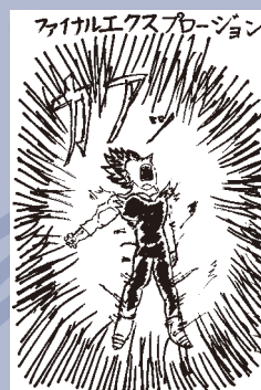
▲笹尾 知弘 (小学4年・近長)