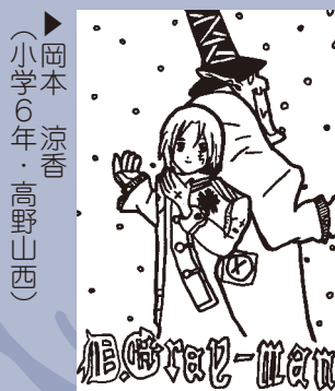
▶岡本 涼香 (小学6年・高野山西)