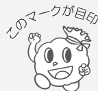
●津山市指定ごみ袋の種類(1パック10枚入り)

その2 津山市(旧市内)の家庭用ごみ袋は有料指定袋です。スーパーやコンビニなど取扱所で販売しています。