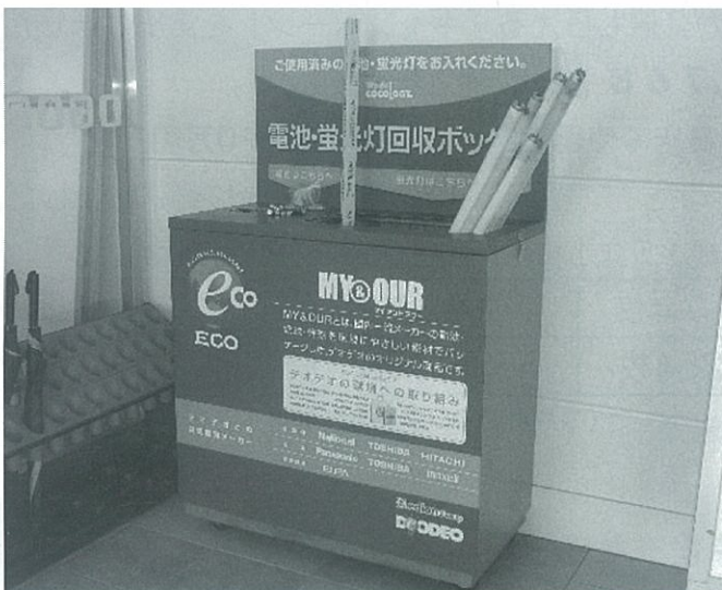
店頭におかれた回収ボックス

回収後は各店が費用を負担し、業者に引き渡す、メーカーに送るなどの方法で処理されています。