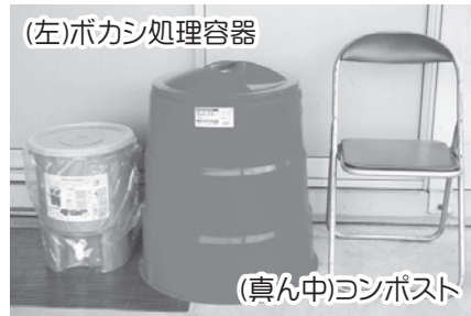
(左)ボカシ処理容器