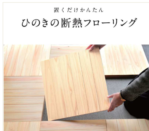
美作材による断熱製品