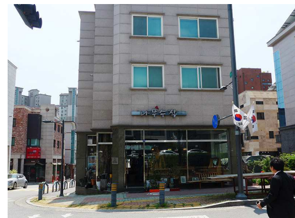
韓国アンテナショップ