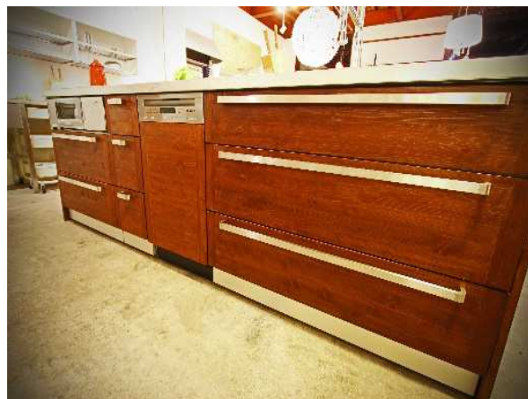
美作材によるカスタムキッチン

韓国へのアンテナショップ開設による美作桧の韓国輸出を支援しているほか、今後津山スタイルにて開発される木製品のプロモーションを進めていき、地域のブランド化を図ります。