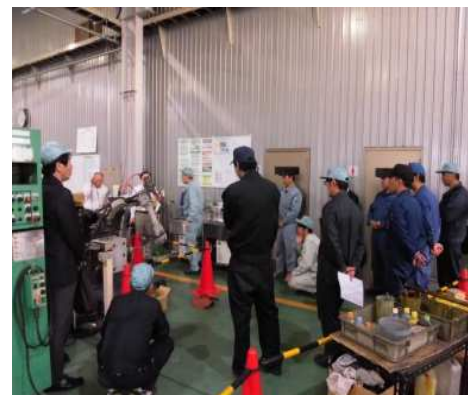
自動溶接機の開発・試験