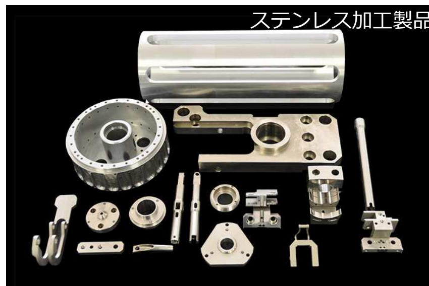
ステンレス加工製品