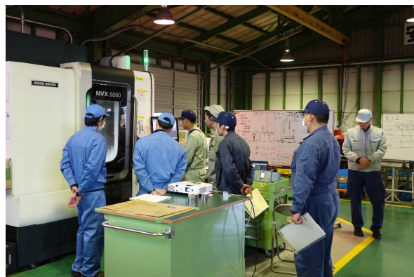
金属加工技術研修

都市圏等で開催される展示会への出展のほか、大手企業への直接営業等で販路開拓を行っているほか、ホームページで活動や各社の技術力をPRしています。