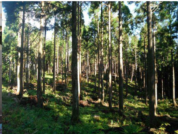
市内の森林（美作材）