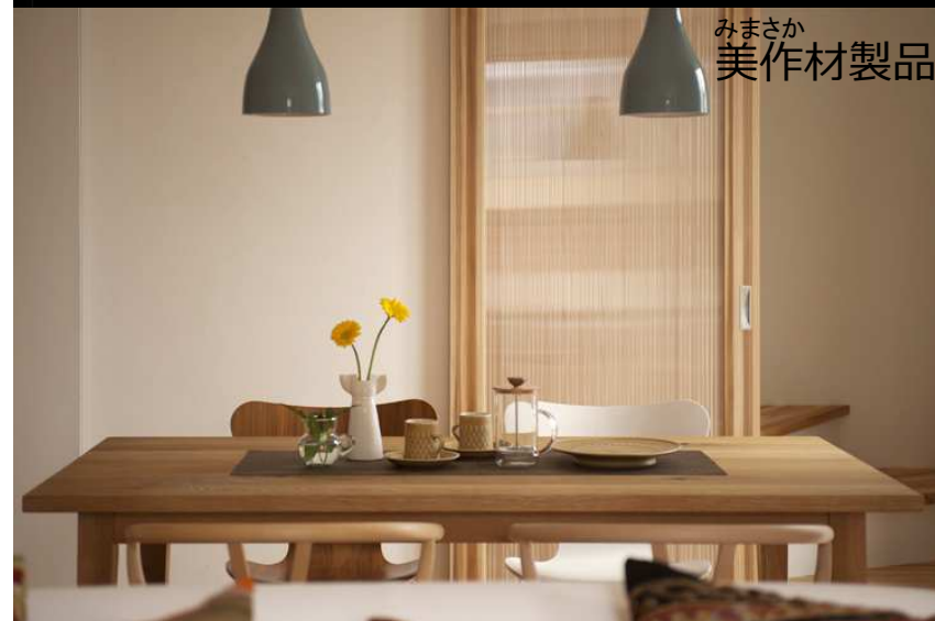
みまさか 美作材製品