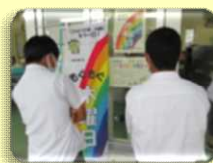
配膳室に掲示してあるポスターに、中学生も興味津々