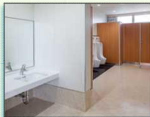
改修後の 勝加茂小学校