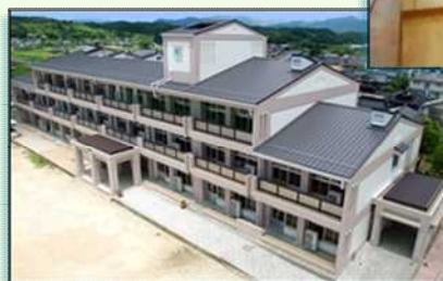
改修後の大崎小学校