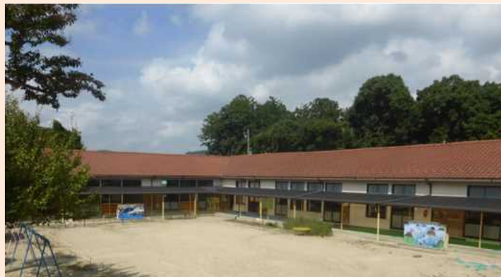
移転先（旧鶴山幼稚園）

移転後も現施設と同様に、落ち着いた環境のなかで、子どもたちの社会的自立をめざして、相談・支援活動を行ってまいりますので、お気軽にご相談ください！