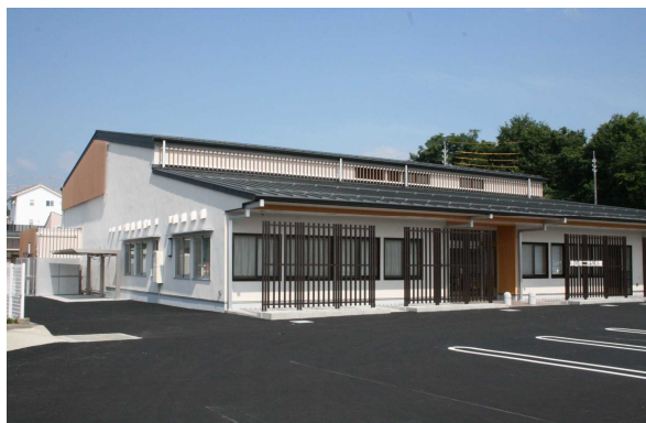
二宮公民館（二宮1982-2） 電話28-3292

生涯学習活動や住民同士の交流、人づくり地域づくりの拠点としてぜひご利用ください。