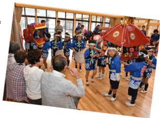
つやま西幼稚園との交流の様子