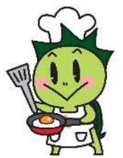
津山市食育推進キャラクター「しよくたん」