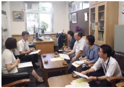
校長・教頭から学校の様子を伺う教育委員

各学校で子どもたちの明るい笑顔、元気なあいさつに迎えられ、校長・教頭先生から学校教育目標・計画、めざす子ども像・めざす学校像などを伺いました。 それぞれの学校では校長先生を中心として先生方が一致協力して、様々な方法でめざす学校の実現に努められていました。