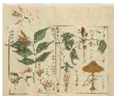
宇田川榕菴自筆資料

宇田川榕菴自筆資料は、津山洋学資料館が収集した宇田川榕菴の自筆及び旧蔵資料です。榕菴の幅広い好奇心を伝えるものであり、榕菴研究において貴重な資料群です。