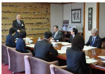
市長と教育委員による総合教育会議

今後も、市長と教育委員会では、教育行政における責任や役割を明確にし、方向性を共有しながら、教育政策を執行していきます。