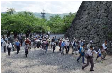
学芸員の解説を聞きながら楽しく津山城をめぐる参加者

数を限定せずに広報したところ、参加者は総勢127人にもなり、市民の皆さんの津山城への関心の高さを再認識しました。