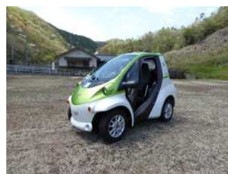
小型電気自動車「コムス」

今後、公民館活動の中で環境をテーマにした講座を充実させ、地域づくりの推進を図りたいと考えています。