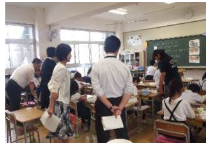
「めあて」にそって頑張る子どもたち

また、地域の方々にも多大な協力をいただいております。多くの人たちが子どもたちを守り、育ててくださっている事