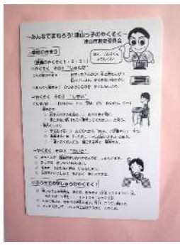
『津山っ子のやくそく』下敷き

義務教育の入門期に落ち着いた当たり前の学習環境を確立していくこと、家庭と連携した家庭学習の定着を図ることを目的として作成、配布しています。