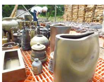
焼き上がった茶碗や花器

登り窯の窯焚きは、年2回行っており、薪を焚いて焼き上げる古来からの伝統的な登り窯では、土や炎の温度、焼き方などで様々な窯変(ようへん)が生まれます。