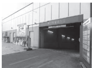
駐車場24時間化の早期実現を

問 合併10年の総括で市民と行政との心理的距離について指摘されている中での改善は。