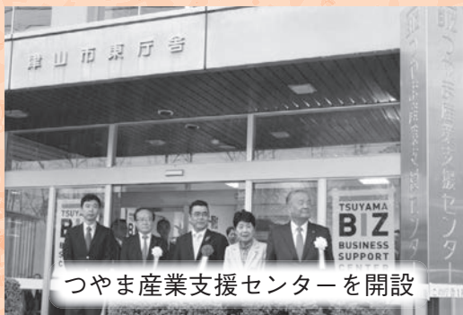
つやま産業支援センターを開設