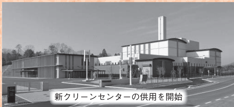
新クリーンセンターの供用を開始