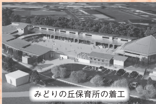
みどりの丘保育所の着工