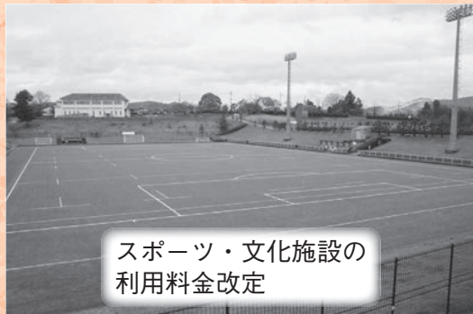
スポーツ・文化施設の利用料金改定