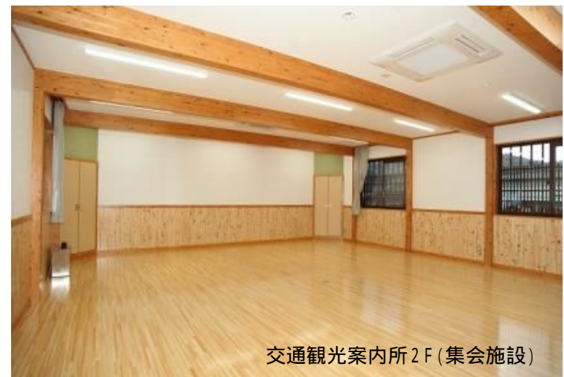
交通観光案内所 2F (集会施設)

利用可能人数: 最大50人まで 施設使用料: 1時間300円 (別途) 冷暖房使用料: 1時間100円 主な用途: 会議・着付け教室など 広さ: 幅7.0m × 奥行7.4m = 約52m 2 施設: バリアフリー対応(専用エレベーターあり)・長机・イス・演台 ホワイトボード鏡2面・プロジェクター・32型TVモニター