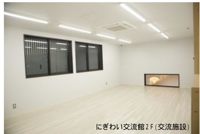
にぎわい交流館 2F (交流施設)

利用可能人数: 最大50人まで 施設使用料: 1時間300円 (別途) 冷暖房使用料: 1時間100円 主な用途: 会議・着付け教室など 広さ: 幅7.0m × 奥行7.4m = 約52m 2 施設: バリアフリー対応(専用エレベーターあり)・長机・イス・演台 ホワイトボード鏡2面・プロジェクター・32型TVモニター