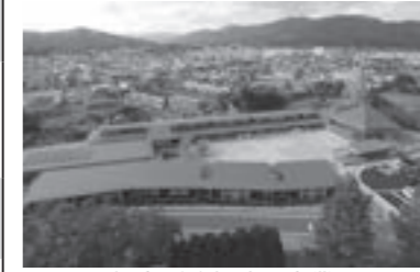
保育所移転建設事業 (市立一宮保育所)