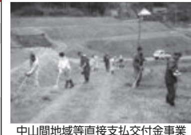
中山間地域等直接支払交付金事業