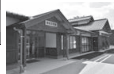
公民館改築等事業 (清泉公民館)