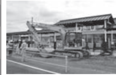
津山駅北口広場整備事業