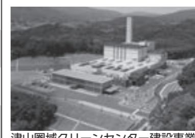
津山圏域クリーンセンター建設事業