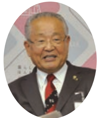
津山市長 宮地 昭範

5歳から太鼓を始め、津山鶴丸太鼓のメンバーとして、津山さくらまつりや音楽祭など数々の舞台で演奏。どんな厳しい練習でも自分から逃げないことをモットーに、力強く、そして人に笑顔と感動を与えられる演奏ができるよう、日々、練習に励んでいる。