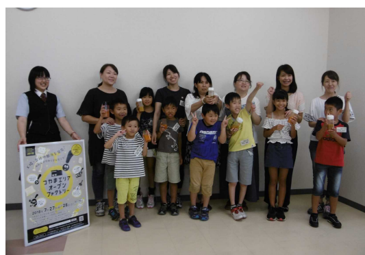
(株)マルイウエストランド店