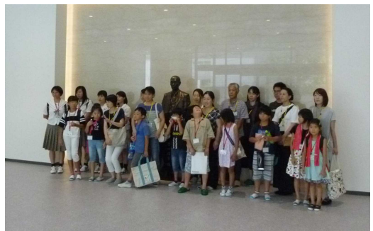
東和薬品(株)岡山工場

「共和機械がどのような会社かを知りませんでした。津山にこんなにすごい会社があって感激しました。」 「中学生のアイデアから始まったということに驚いた。取引先の要望にそれぞれ応えていく技術がすごいなと思った。」