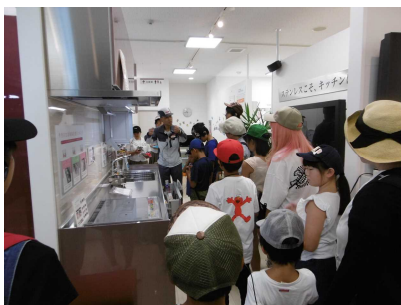
クリナップ(株)岡山工場

「どんなものを作っている会社なのか、初めて知ることばかりでとても興味を持ちました。津山にもすごい会社があるとわかって良かったです。」 「エアコンはこうやって作られているんだなと思った。環境実験室が涼しくて楽しかった。実感できた。」