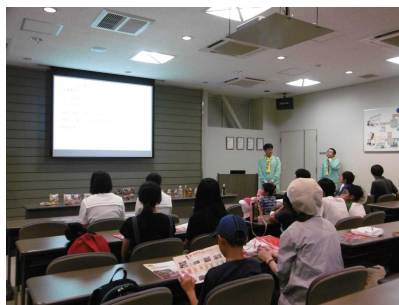
エバラ食品工業(株)津山工場