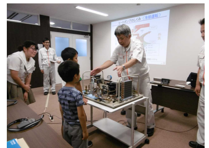
東芝キャリア(株)津山工場