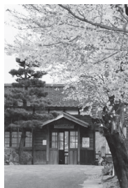
美作滝尾駅をより快適に

答 設置費用・維持管理費の発生等を踏まえ、手法を探りながら前向きに検討していきたい。