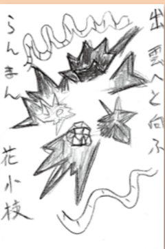
▶工藤 圭志 (上河原)