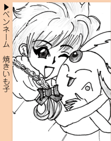
▶ペンネーム 焼きいも子