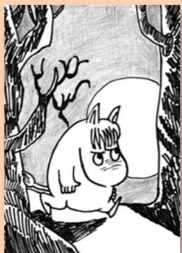
▶ペンネーム 里いも子