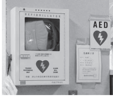
1階課 舎に設 置され るAED の設置 状況 （津山 市役所 南側の 柱に設 置され ている）