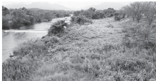
押入から高野本郷に向かって見た加茂川

答 現状の草木が多く茂った状況は増水時の通水を妨げる状況となっている。管理者の県に働きかけたい。