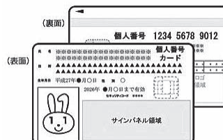
個人番号カード (イメージ)