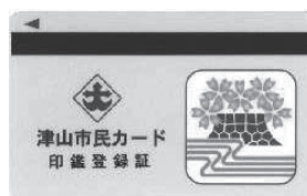
津山市民カード (イメージ)