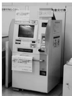
自動交付機は平成28年3月で廃止されます。

登録手帳が必要である。また、個人番号カードを利用した印鑑登録証明書及び住民票の写しのコンビニ交付については、全国の間も拡大されることから、市民の利便性が大きく向上されるものと考えている。