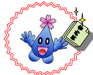
津山市水道局マスコットキャラクター ブロックちゃん