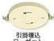
引掛埋込 ローゼット 引掛露出 ローゼット