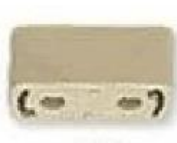
角型 引掛シーリング