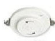
フル引掛 ローゼット