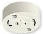
丸型 引掛シーリング