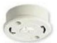
丸型フル引掛 シーリング