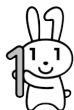
PRキャラクター マイナちゃん

※法律で定められた目的以外で、マイナンバーを利用したり、他人に提供したりすることはできません