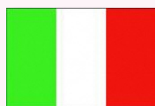
ソレント (イタリア)