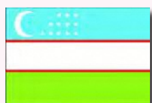
ブハラ (ウズベキスタン)