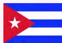
オルギン (キューバ)